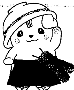
佐野ブランドキャラクターぞのまる©佐野市