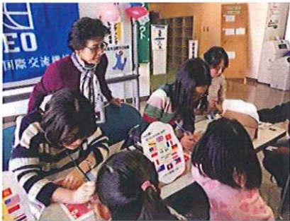
「ふれあいフェスティバル」での 国旗ペイント 小学生に大人気です！