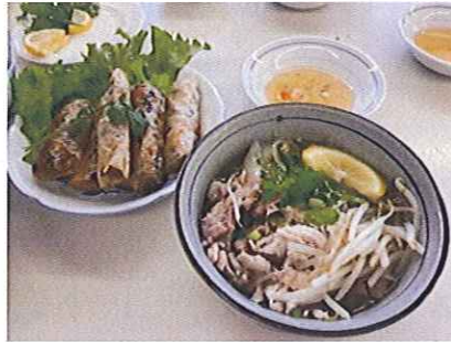
おいしい揚げ春巻きとフォーが 完成！