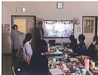
「オージーランチパーティー」での オーストラリア人による文化紹介