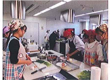
小中学生や家族参加、初めて 会った人とも楽しくできました！