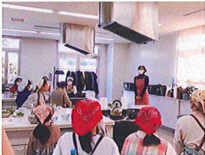
ベトナム人講師からの説明を 真剣に聞いています！

12/3（日）に、パルティとちぎ男女共同参画センターにて栃木県ベトナム人会（VAT）の皆様と楽しくベトナム料理セミナーを開催しました。ランチタイムに揚げ春巻きとフォーを作り、ベトナム文化やベトナム語を楽しく学びました。小中学生から大人まで、皆で楽しくおいしいひと時を過ごしました。