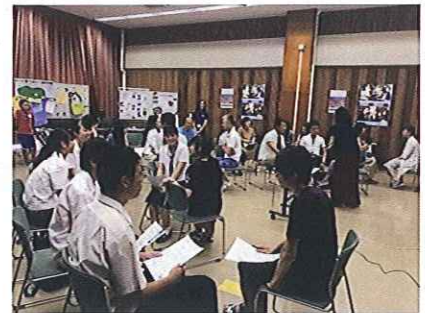
「とちぎグローバルセミナー」での 既参加青年との座談会