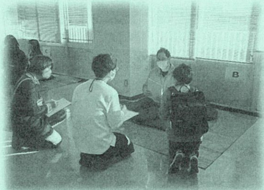
避難所巡回体験の様子