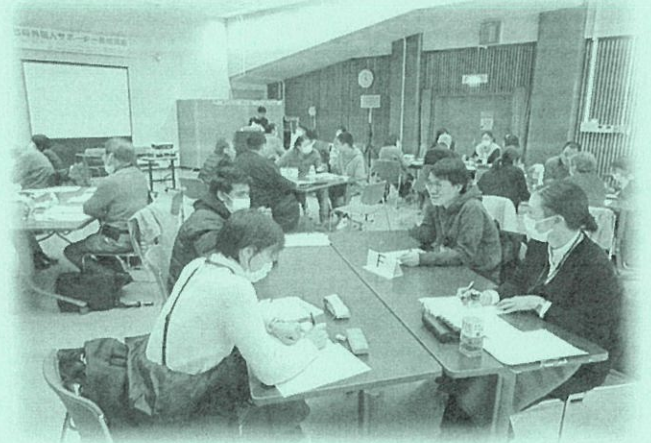
昨年度のサポーター養成講座